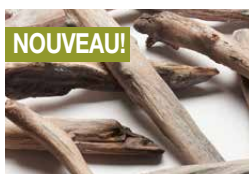
Bois de grève réaliste