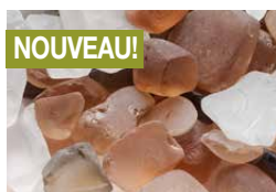
Éclats de verre