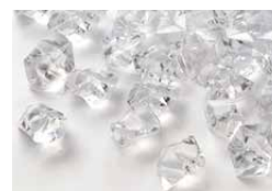
Cristaux en acrylique